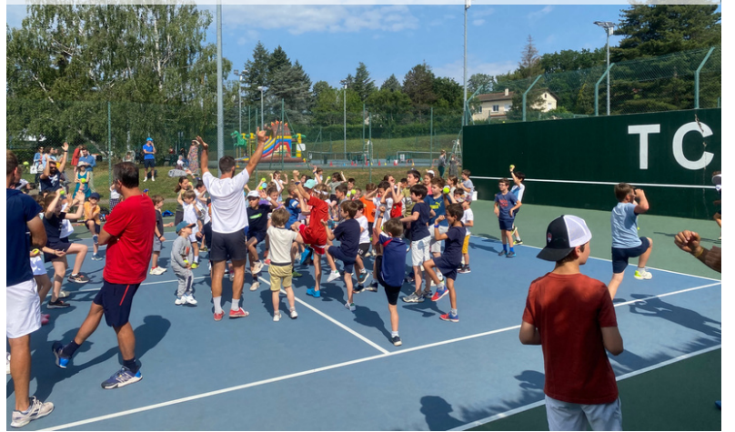
C'était le fête du tennis le mercredi 14 Juin. Le beau temps était au rendez-vous !