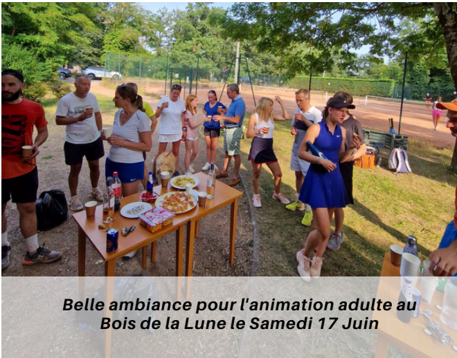
Belle ambiance pour l'animation adulte au Bois de la Lune le Samedi 17 Juin