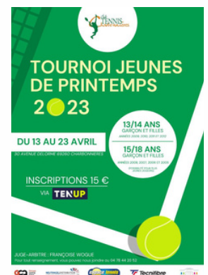
Les affiches des deux tournois