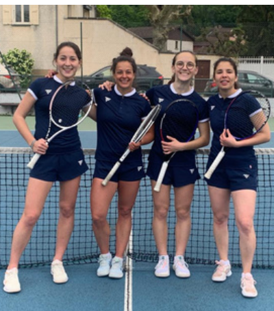
Notre équipe 1 Dames 2023